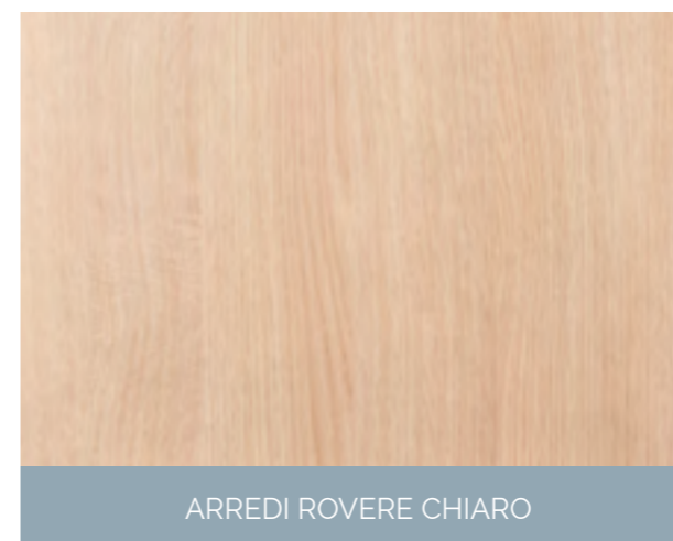
ARREDI ROVERE CHIARO