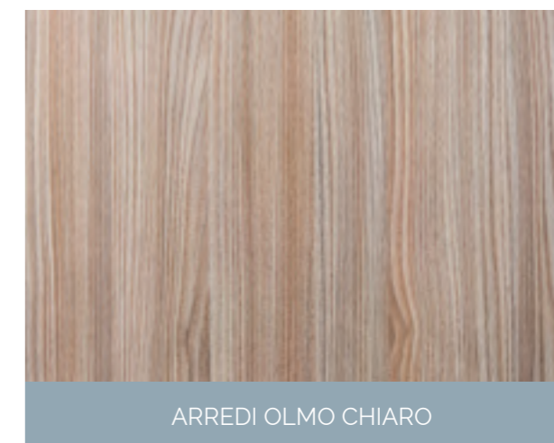
ARREDI OLMO CHIARO