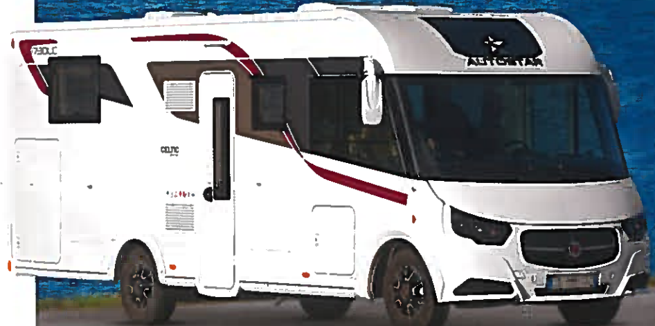
SUPERTEST AUTOSTAR 1730 LC Celtic Edition

Faut-il multiplier les panneaux solaires ?